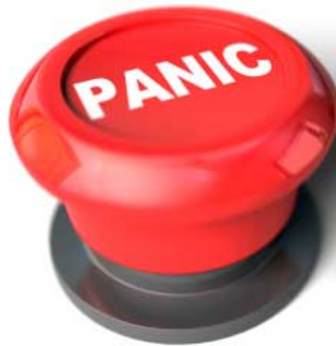
Figura 1: Botão de pânico

Após ingressar no curso de engenharia, seu professor pediu para seus alunos fazerem um projeto simples para a matéria de introdução a engenharia. O aluno lembrou de sua ideia e tentou colocá-la em prática.